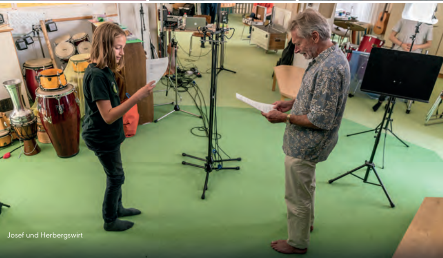
Josef und Herbergswirt

„Es geschah aber in jenen Tagen, dass Kaiser Augustus den Befehl erließ, den ganzen Erdkreis in Steuerlisten einzutragen. Diese Aufzeichnung war die erste; damals war Quirinius Statthalter von Syrien. Da ging jeder in seine Stadt, um sich eintragen zu lassen. So zog auch Josef von der Stadt Nazaret in Galiläa hinauf nach Judäa in die Stadt Davids, die Betlehem heißt; denn er war aus dem Haus und Geschlecht Davids.“