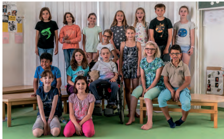
Monte-Chor der Aktion Sonnenschein