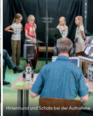
Hirtenhund und Schafe bei der Aufnahme